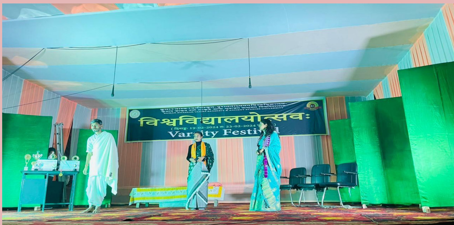
One Act Play by the Students during Varsity Festival