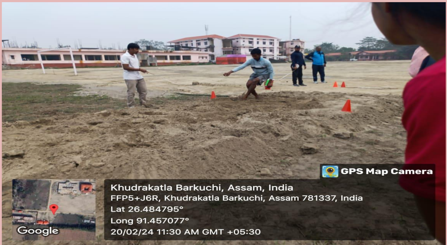
Long Jump Competition under Sports Unit during Varsity Festival, 2024