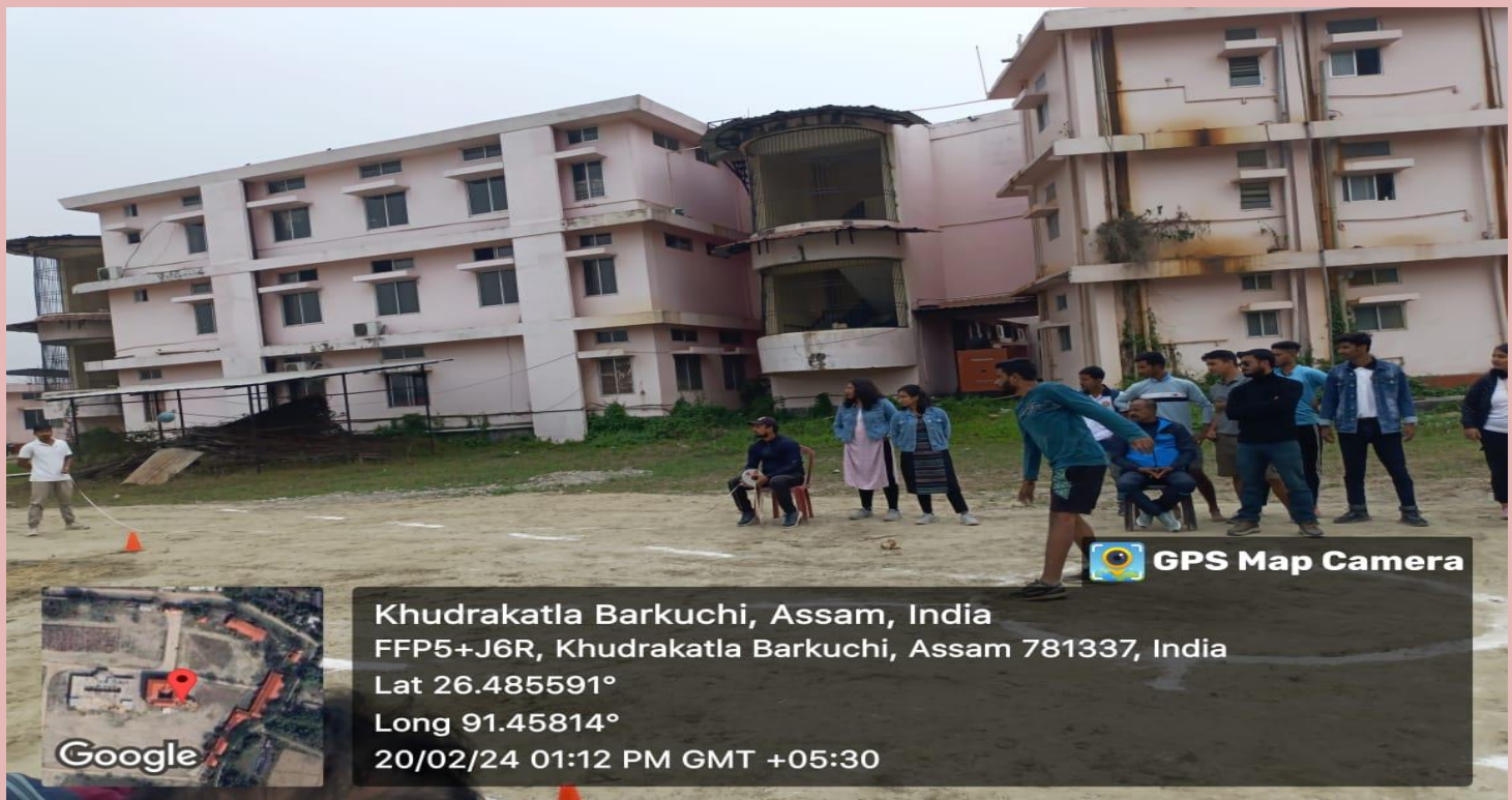
Participation of Students in the Athletics event during Varsity Festival, 2024