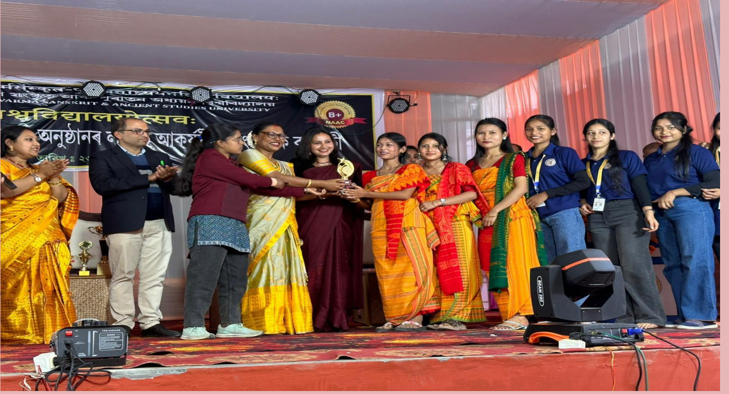
Receiving Awards during Prize Distribution ceremony of Varsity Festival, 2024