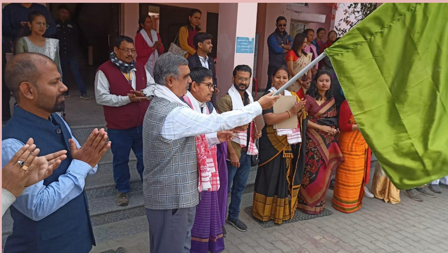
Flag off by Hon'ble Vice Chancellor in inaugurate the Cultural Procession of Varsity