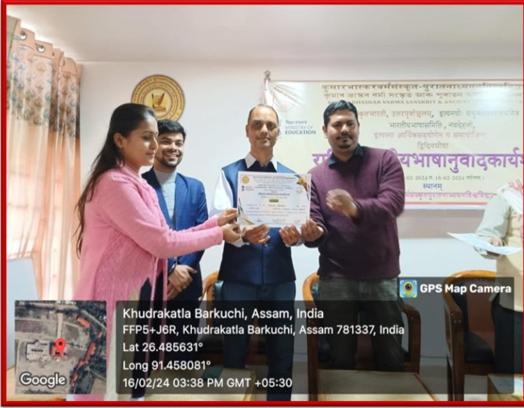
Khudrakatla Barkuchi, Assam, India FFP5+J6R, Khudrakatla Barkuchi, Assam 781337, India Lat 26.485631° Long 91.458081° 16/02/24 03:38 PM GMT +05:30