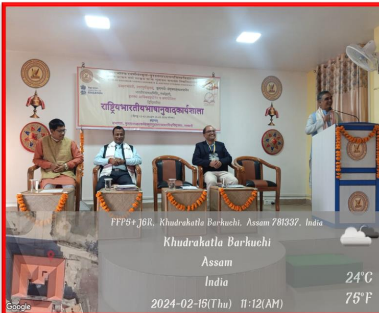
FFP5+J6R, Khudrakatla Barkuchi, Assam 781337, India