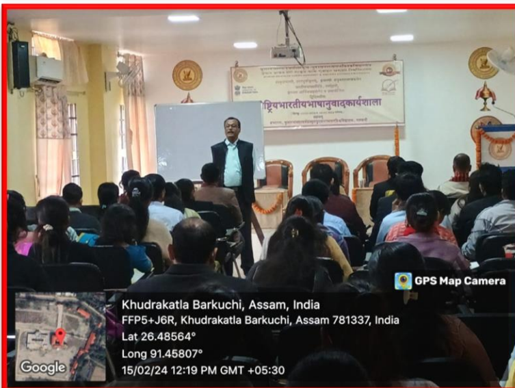
GPS Map Camera

Khudrakatla Barkuchi, Assam, India FFP5+J6R, Khudrakatla Barkuchi, Assam 781337, India Lat 26.48564° Long 91.45807° 15/02/24 12:19 PM GMT +05:30