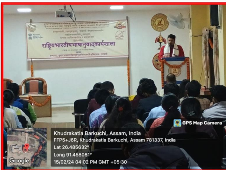
GPS Map Camera

Khudrakatla Barkuchi, Assam, India FFP5+J6R, Khudrakatla Barkuchi, Assam 781337, India Lat 26.485635° Long 91.458079° 15/02/24 02:05 PM GMT +05:30