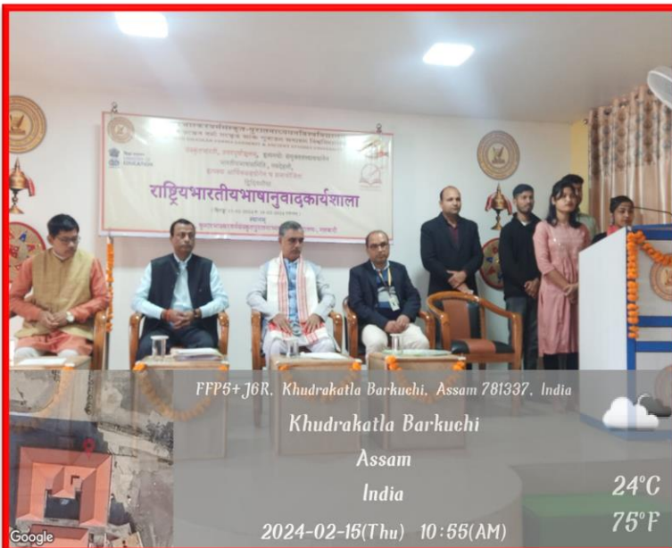
FFP5+J6R, Khudrakatla Barkuchi, Assam 781337, India