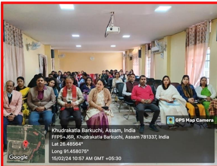
GPS Map Camera

Khudrakatla Barkuchi, Assam, India FFP5+J6R, Khudrakatla Barkuchi, Assam 781337, India Lat 26.48564° Long 91.45807° 15/02/24 12:19 PM GMT +05:30