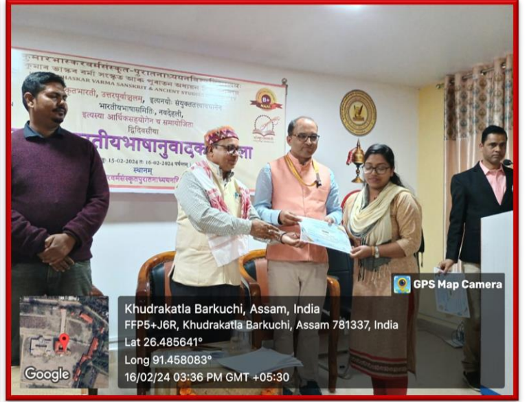
Khudrakatla Barkuchi, Assam, India FFP5+J6R, Khudrakatla Barkuchi, Assam 781337, India Lat 26.485641° Long 91.458083° 16/02/24 03:36 PM GMT +05:30

कुमारभास्करवर्मसंस्कृतपुरातनाध्ययनविश्वविद्यालये